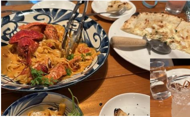
食べ物の写真はいつも取り忘れる