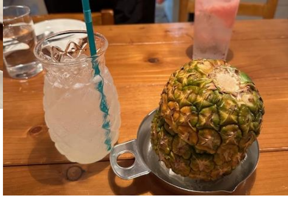
豪快なパイナップル生絞りサワー